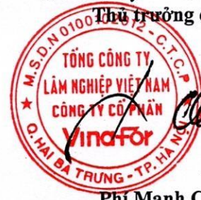
Phí Mạnh Cường