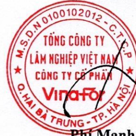
Phí Mạnh Cường