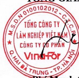
Phí Mạnh Cường