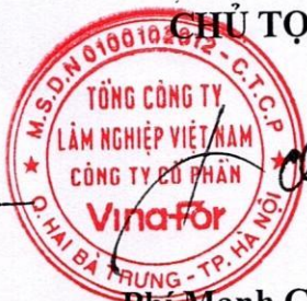
Phí Mạnh Cường Chủ tịch HĐQT