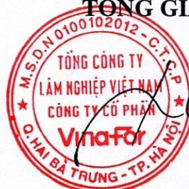
Phí Mạnh Cường